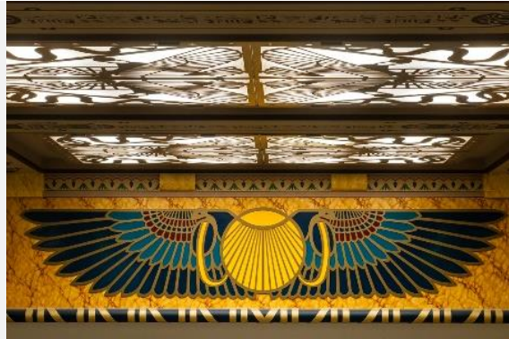
cinéma Le Louxor

Construit en 1921 par l'architecte Henri Zipcy, au 170 du boulevard de Magenta, le cinéma Le Louxor témoigne de la continuité de l'influence égyptienne qui traverse les siècles. Inscrite à l'inventaire supplémentaire des monuments historiques, la façade néo-égyptienne du bâtiment est décorée de mosaïques multicolores, de motifs floraux, de scarabées, de cobras et d'un immense disque ailé.