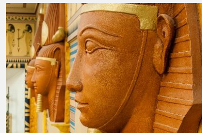
cinéma Le Louxor